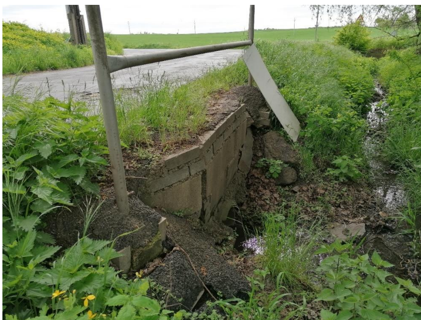
Pohled na výtok

Propustek je tvořen rozpadlými betonovými čely osazenými zrezivělým zábradlím. V rámci opravy komunikace bude propustek obnoven formou ŽB trouby DN 600 délky 7,60m.