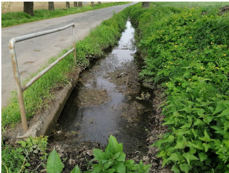
Pohled na vtok